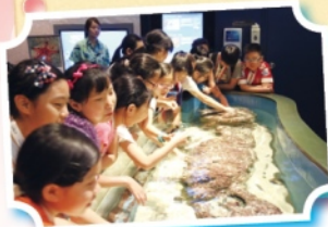
Close up with sea creatures