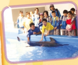
第一次近距離與海豚接觸。

11月27日，老師帶我們走出校園到海洋公園去學習。那天，我可以近距離接觸海洋生物和觀看企鵝活動的情況，十分開心呢！