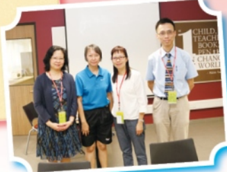
Our teachers shared teaching ideas with Singaporean teachers.

We're at the famous tourist spot—Merlion Park.