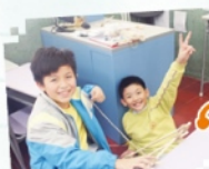
同學們都享受製作「羅馬炮架」的過程。

在科技活動日中，我和組員齊心合力，利用長木筷子製造「羅馬炮架」。在製作過程中，我們遇到不少困難，幸好得到老師的用心教導和幫助，我們終於順利完成。這次活動令我學會課堂外的科學知識，我感到十分興奮呢！