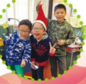
帥哥們齊齊過聖誕！