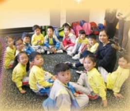
小二和小四的同學互相鼓勵，發揮合作精神，共同完成各項歷奇活動。