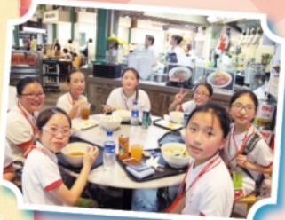
Our first meal in Singapore