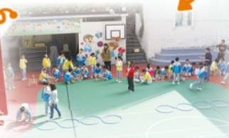
同學們到操場做實驗。