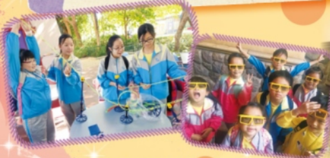
小一和小六的同學到迪士尼樂園進行學習呢！