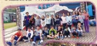
充滿歡樂回憶的教育營

快要畢業了，很多開心、傷心的事情都一一重現在眼前。還記得初踏進校門的時候，我一無所知，但經過老師們的悉心教導，令我煥然一新。我很高興能在這個充滿人情味的地方學習。謝謝各位老師無微不至的教導，也謝謝校長、職員及工友們多年來的照顧。