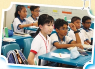
Learning with our Singaporean buddies