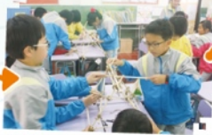
同學們在製作「羅馬炮架」的過程中，發揮合作精神。