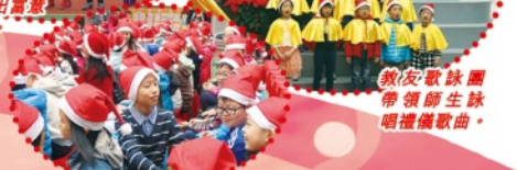
全體師生及聯工互祝平安。