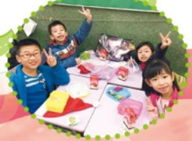
與同學們一起享受派對食物。