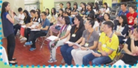
支援有特殊學習需要的學生——個案分享及討論工作坊