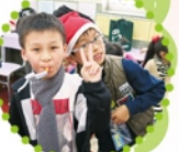
聖誕小玩具真好玩！