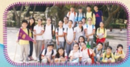
這是我們畢業前最後一次秋季旅行