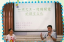
一班之主——建構關愛的課室文化工作坊